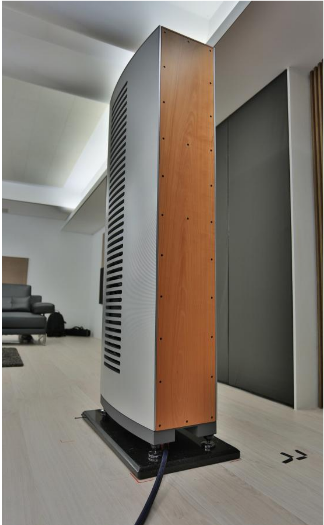
兩個 25 公分口徑的大尺寸低音單體位於喇叭箱體側面。

因為低音單體擺在喇叭側邊，而且是單邊設置，這產生了一個擺設喇叭的問題：究竟低音單體要朝內還是朝外？Burmester 的標準答案是朝內擺放，兩個低音單