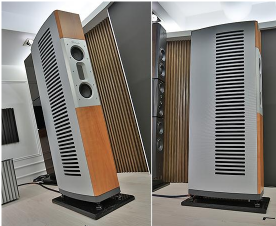
旗艦級 B100 落地喇叭身高 149 公分，重量卻高達 128 公斤。

身為 Burmester 的旗艦喇叭，它的身高比起照片看起來的想像稍矮，實際上是 149 公分高，為什麼不設計得更高一些，看起來不是更有氣勢？ Burmester 的想法很簡單，音響也是家中擺設的一部份，如果喇叭很高，視覺上可能會有壓迫感。當然，喇叭要高或不高才好看，那是見仁見智的設計取向， Burmester 只是挑選他們認為「適當的高度」來設計 B100 。