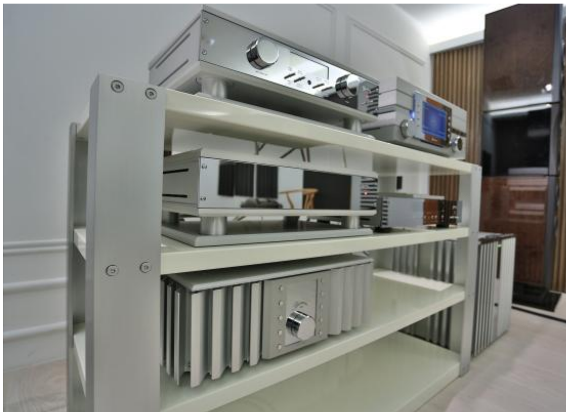
Burmester 不僅器材美觀，連音響架也很漂亮。

Burmester 標榜的哲學是「Art for the Ear」，也就是「聆聽的藝術」。Dieter Burmester 很早就把音響的境界，提升到藝術的層次，如果不是追求音樂重播的極致藝術，Burmester 也不需要這般處處講究、細細琢磨。統元搭配的 Reference 系統，包括了 B100 落地喇叭、111 Musiccenter、077 前級、909 後級，線材搭配則是 Burmester 電源線與 Cardas 訊號線混搭。前端的 111 Musiccenter 與 077 前級，經過 948 電源處理器供電，而耗電量大的 909 後級，則是直接從牆壁上的插座取電。還有，統元連音響架都搭配 Burmester，整體視覺效果更好。以前沒有特別注意 Burmester 的音響架，注意力都擺在漂亮的器材上面，統元這般全套搭配，才讓我注意到 Burmester 的音響架，全部搭在一起真是好看。