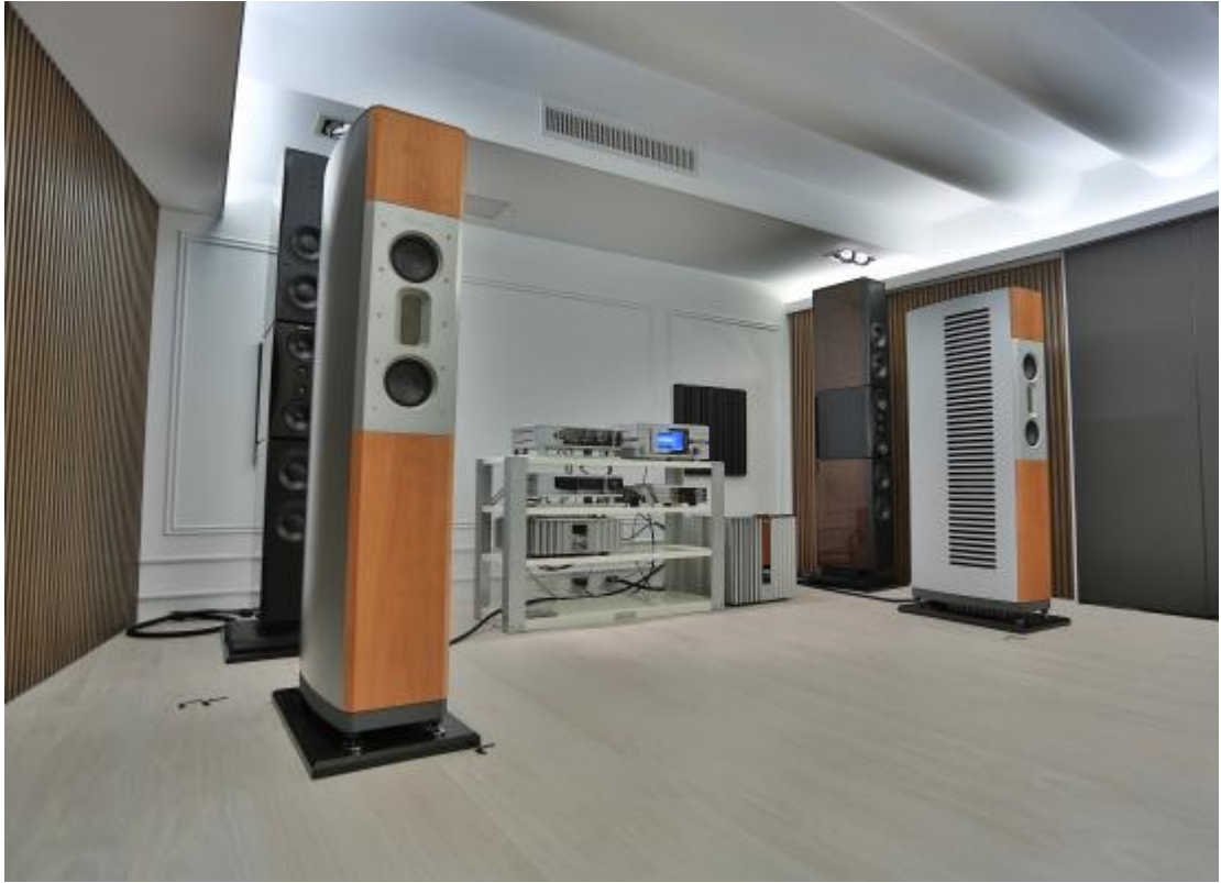
B100 附近許多貼上膠帶的記號，顯示統元嘗試過許多位置，最後才把 B100 定位在這裡。