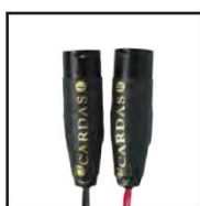
Dual 3 pin XLR