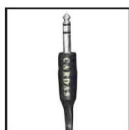
Cardas 1/4" Stereo