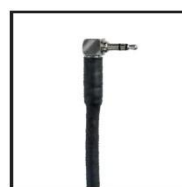
90* 1/8" Stereo