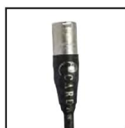
Single 4 pin XLR