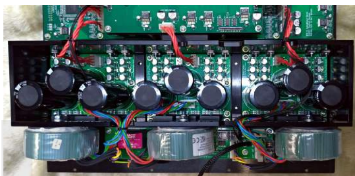
MPD-8內部採用三組獨立供電，而且都是線性電源。

MPD-8的背板同樣也是擁有自家PLink光纖端子，以及其他數位輸入端子。類比輸出端XLR與RCA都有。