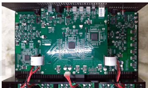
MPD-8內部的數位處理中樞，總共使用4個FPGA。

最後聽剛推出的「DALI CD 5」。此時我更清楚的感受到這張CD錄音的優異。雖然幾乎都是流行音樂，但是音質很好，而且每首錄音都好像被光澤包住。樂器與人聲形體健康飽滿，相互之間都有可以清楚「看到」的間隔距離，不會緊緊地擠在一起。而且在飽滿紮實的低頻節奏中，可以清楚感受到低頻的彈性，以及整體音樂的活生感。在這張「DALI 5」中，我聽到了寬鬆的感覺。我在懷疑，這份寬鬆的感覺到底是MPT-8、MPD-8的特質呢？還是錄音採用絕少壓縮的結果？