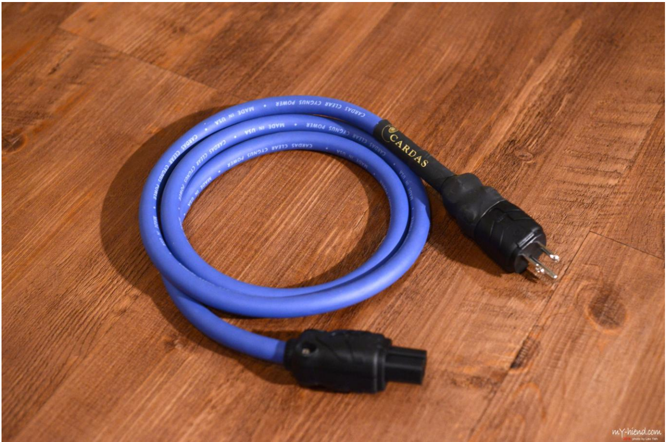
Cardas 3455R 純銅鍍銻跟銀電源公母頭。

Clear 與 Cross 都使用了 Cardas 黃金比例(Golden Ratio)、超高純度的銅(ultra-pure copper)與多股李茲結構(multi-stranded Litz)的導體。所有的線材都在美國手工製作。 Cross 系列的誕生是因應早期數位時代常有的生冷尖銳數位感，因此線材走向比較溫暖，Clear 系列則是更為中性自然與有最佳的動態，更為透明、結像定位更好。除了 Clear Reflection 外，Clear 系列的線身以深藍色為主。Clear Cygnus 電源線的幾合結構與高階的 Clear Beyond 相似，以同樣比例精簡，在價格下降外，保有精華的聲音表現，使用 Cardas 3455R 純銅鍍銻跟銀電源公母頭，除了 15A 外，也提供 20A 的版本。Clear Cygnus 適用於所需電流較小的訊源、DAC、前級為主，或是小型的擴大機。