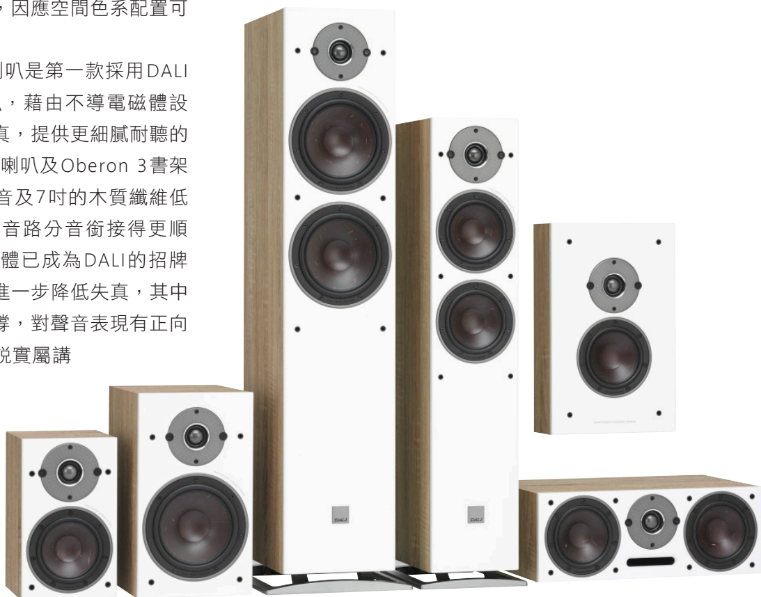
Oberon 系列喇叭中，提供 6 款不同形式不同尺寸喇叭供選擇。

雖然 Oberon 系列喇叭 Oberon 7 落地喇叭及 Oberon 3 書架喇叭，單體尺寸很有誠意給予了 7 吋大口徑，但若想要擁有更加震撼的電影效果，加一顆重低音喇叭是必須的，考量 Oberon 系列喇叭特性，搭配了 Velodyne Wi-Q10 主動式超低音喇叭，採用低音反射式箱體，並搭載 10 吋低音單體，官方稱呼為超低音喇叭，是因為 Velodyne 為兼具音樂效果所設計的低音，能夠在保有低音細節及質感前提下，提供優異的量感及震撼感。