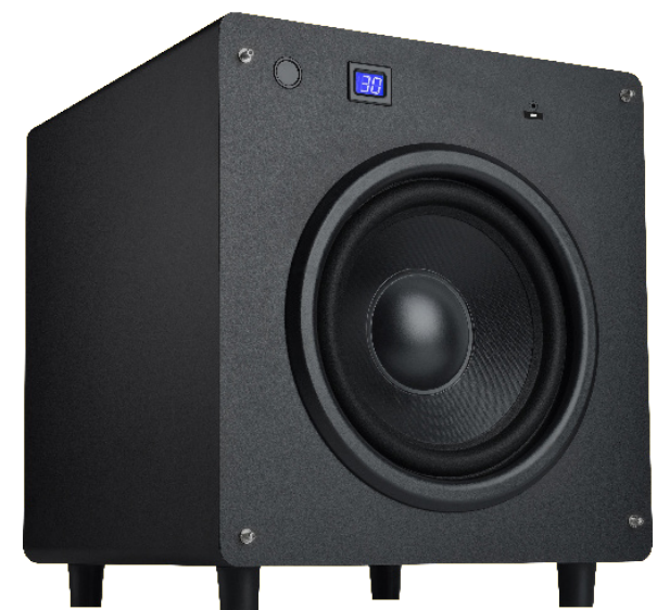
03 Velodyne Wi-Q10 SUBWOOFER