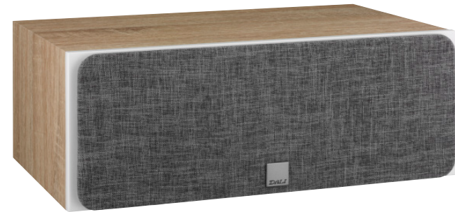
02 DALI Oberon VOKAL CENTER