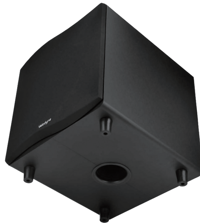
Velodyne Wi-Q10 超低音喇叭為下置式低音反射孔，讓低音擴散更加均勻。

Velodyne Wi-Q10 有一特點為提供無線接收功能，藉由發射器無線傳輸訊號給 Velodyne Wi-Q10 主機，讓超低音喇叭擺位更加自由，也增加聲音調整的便利性。