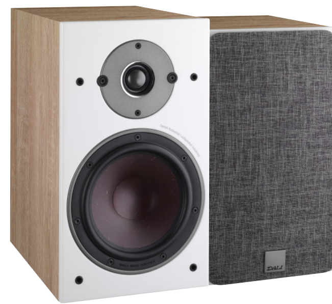
04 DALI Oberon 3 SURROUND