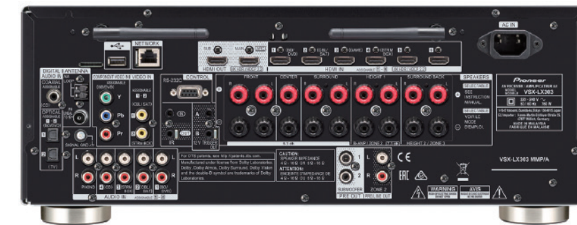
Pioneer VSX-LX303 有 9 組獨立放大器，可做 7.2.2 聲道配置。

整體來說，Oberon 系列喇叭、Velodyne Wi-Q10 超低音與 Pioneer VSX-LX303 的搭配，相當適合多數家中情境使用，大小適當的空間能夠獲得有力音效表現，想過癮也不必擔心大音量下被震得頭昏眼花，還「不小心」邀請了鄰居一同欣賞，對於電影與音樂的愛好者來說，會是相當好的組合。