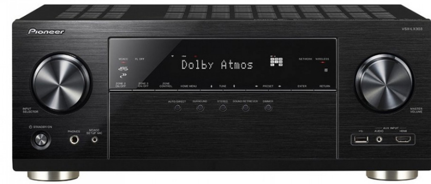
05 Pioneer VSX-LX303 AV RECEIVER

01 主聲道：DALI OBERON 7 型式：2 音路低音反射式 單體：29mm 軟膜高音、 7 吋木質纖維中低音 × 2 頻率響應：36Hz~26kHz(±3 dB) 靈敏度：88.5dB 阻抗：6Ω 尺寸：寬 200× 高 1015× 深 340mm 重量：14.8kg 參考價格：45,800 元 / 對